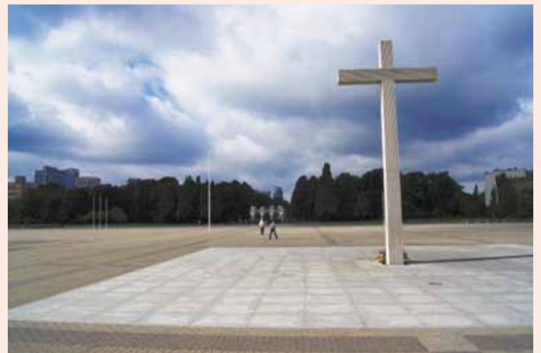
Na Plac Piłsudskiego nie powróci Pałac Saski i Pałac Brühla

Abstrahując od nieudolności inwestycyjnej, także sama prezentowana przez ratusz wizja nowego zagospodarowania otoczenia PKiN, oparta na zgrupowaniu