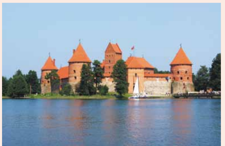
Zamek w podwileńskich Trokach, którego odbudowa zakończyła się w latach 90-tych XX w.

na tym terenie monumentalnych wieżowców, budzi kontrowersje. Uczestnik jednej z debat publicznych określił je jako „marzenie nuworysza o mercedesie”, inni mówią o azjatyckich wzorcach i kompleksach wybijających z prezentowanych koncepcji. Jedno jest pewne – mimo 4 lat tzw. prac nad nowym planem miejscowym władzom miasta nie udało się zbudować kompromisu wokół „nuworyszowskich” wizji centrum.