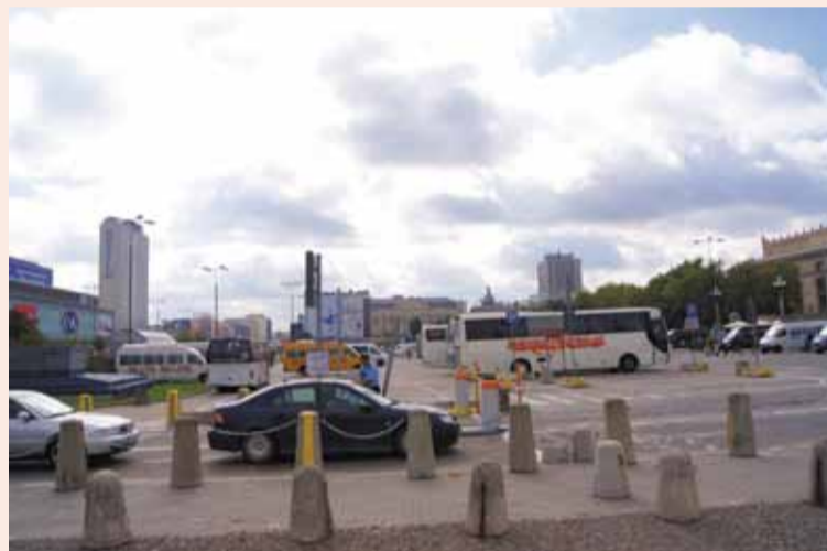
Dziś centrum Warszawy to przede wszystkim ogromy, europejski... parking