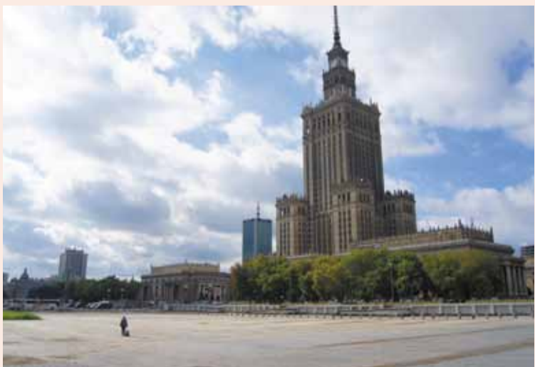
Tu stała hala KDT, którą rozebrano aby pilnie rozpocząć budowę Muzeum Sztuki Nowoczesnej...

Prezydentem Warszawy został wybrany prof. Lech Kaczyński. Prace zainicjowane przez nową ekipę doprowadziły w 2006 roku do uchwalenia miejscowego planu zagospodarowania przestrzennego otoczenia PKiN. Po 17 latach od odzyskania przez Polskę suwerenności ustanowiono podstawę prawną do budowy nowego centrum Warszawy. Plan z 2006 r. zakładał odtworzenie – na tyle na ile po latach jest to możliwe – przedwojennego charakteru zabudowy śródmiejskiej.